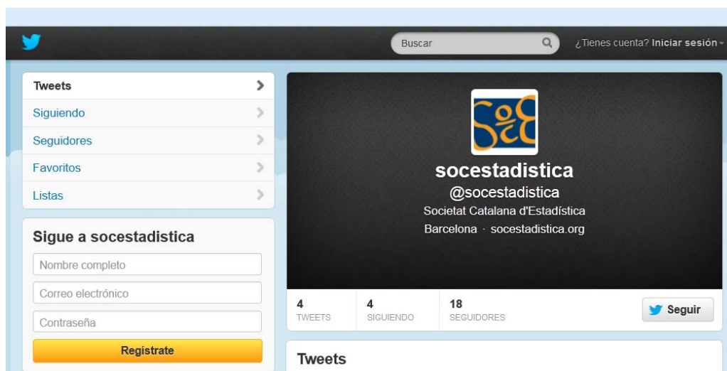
Vista de la pàgina de Twitter de la Societat.

Des del passat 17 de novembre, la Societat està present també a la xarxa social Twitter.