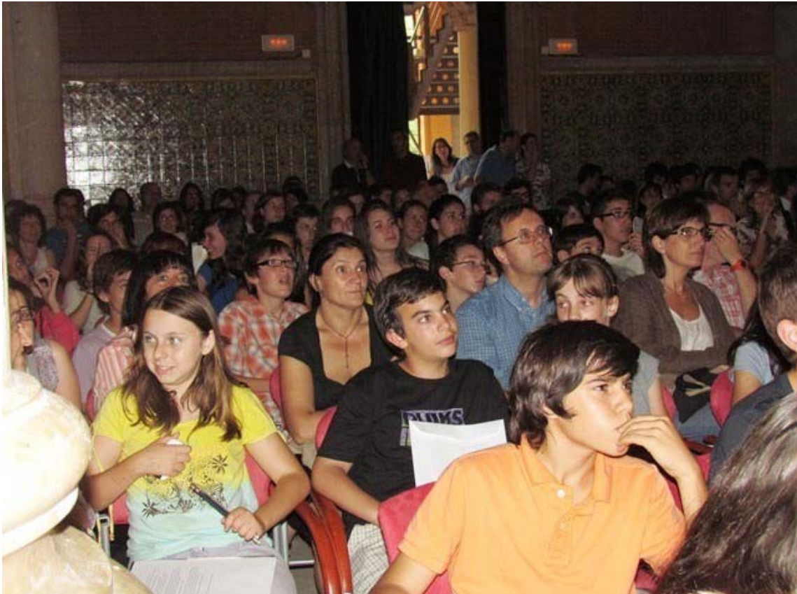
Assistents a l'acte d'entrega de premis del concurs de Planter de Sondeigs i Experiments.

A més a més, es van otorgar diverses mencions especials del Jurat tant a treballs, com a tutors i centres.