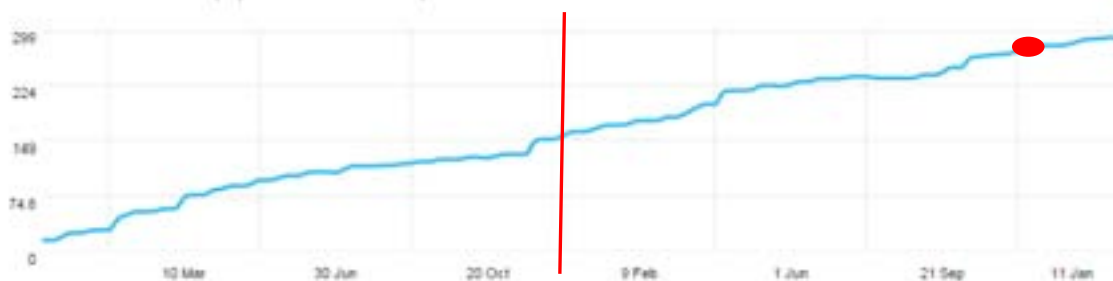
Evolució del nombre de seguidors a la xarxa social de Twitter

La Societat Catalana d'Estadística ha continuat present durant el 2014 en les dues xarxes socials més populars: Facebook i Twitter . Les dues plataformes estan vinculades entre si, de manera que tota l'activitat de Twitter queda reportada automàticament a Facebook .