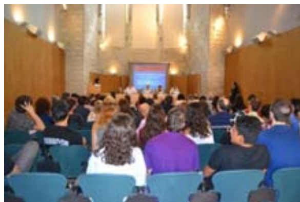
Pòster divulgatiu del Dia de l'Estadística. Imatges de la Sala de Graus de la Universitat de Girona durant la celebració.