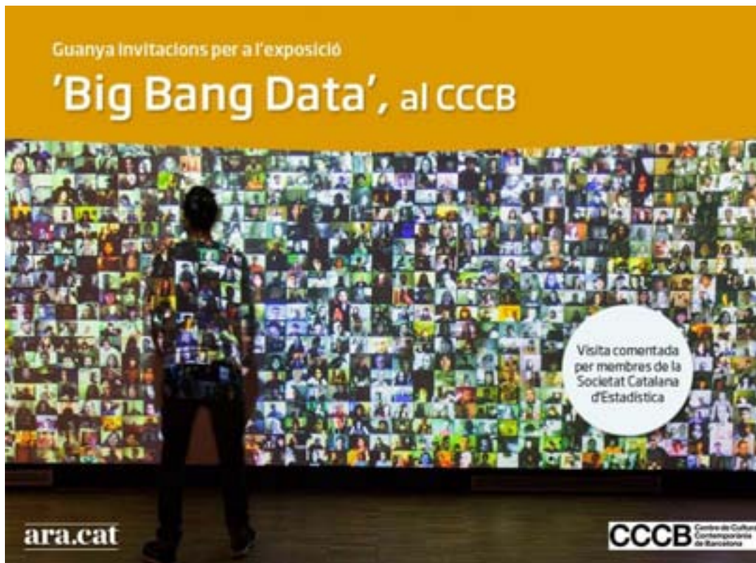
Creativitat apareguda al diari ARA per l'anunci del sorteig d'entrades per a l'exposició Big Bang Data