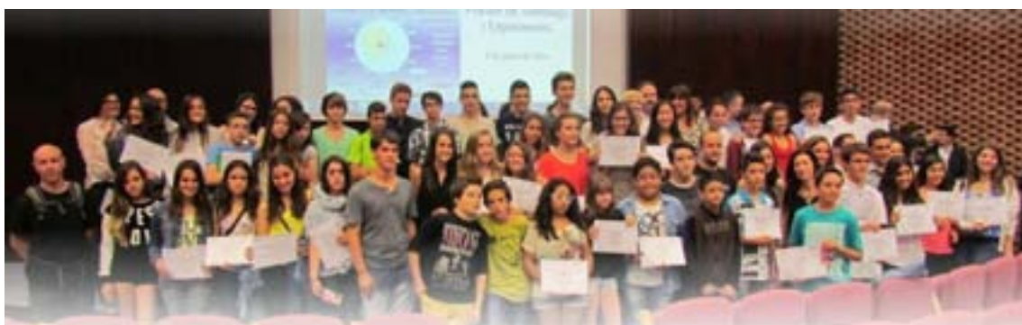
Imatges de l'entrega de premis del concurs del Planter i Sondeigs d'Experiments