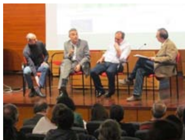
Pòster divulgatiu de la Primera Jornada d'Estadística i Big Data. Imatges del públic assistent i de la taula rodona