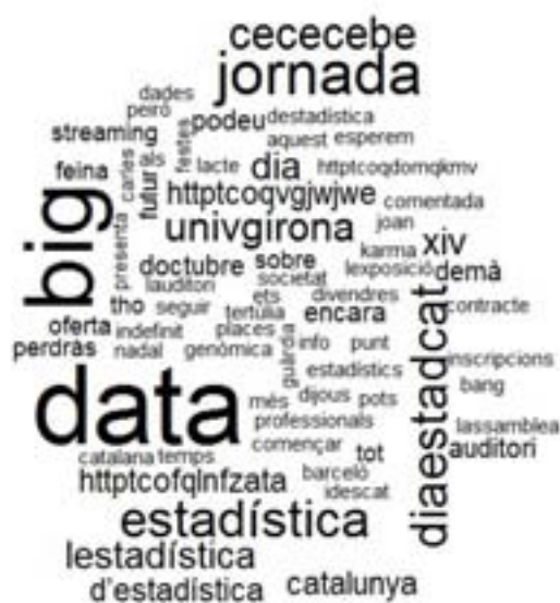
Wordly de les paraules més freqüents als missatges (piulades) del Twitter de la SCE