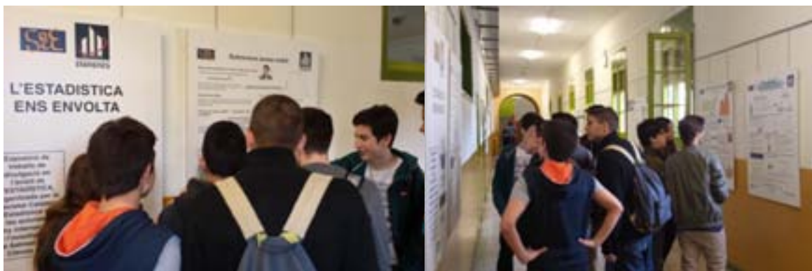
Exposició de pòsters “L'Estadística ens envolta” a l'Institut Santa Eulàlia, de l'Hospitalet de Llobregat

La UdG va tenir els pòsters fins a finals d'abril, coincidint la clausura de l'exposició amb la diada de Sant Jordi. La següent setmana, va ser el torn de l'Institut Santa Eulàlia de l'Hospitalet de Llobregat, en el qual varen exposar els pòsters durant la jornada de portes obertes que porta a terme l'Institut. Finalment des del mes de maig fins a desembre, l'exposició ha estat a l'Institut Vallès, de la localitat de Sant Quirze del Vallès.