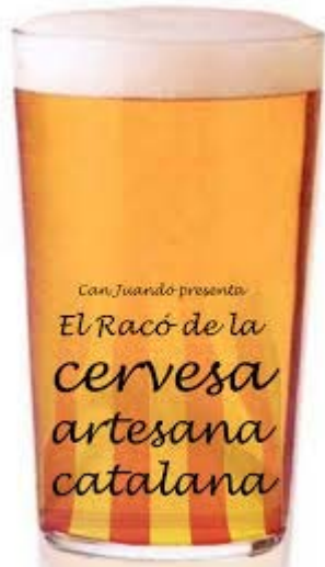
t-student WS Gosset Guinness