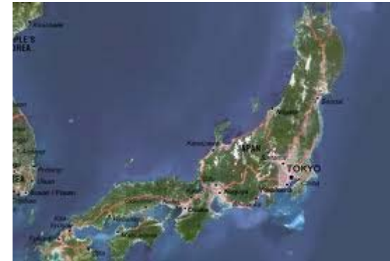
Plan-Do-Study-Act WE Deming Indústria japonesa