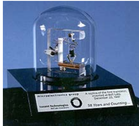
Gràfic de control factor que introdueix variabilitat vs. soroll W Shewhart Laboratoris Bell