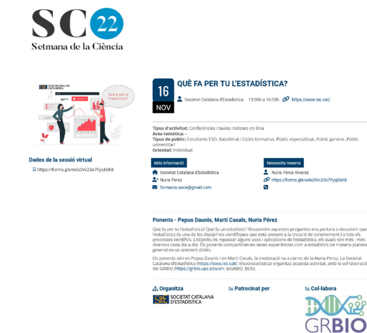
Descripció de l'activitat de "Per a què serveix l'estadística?" a la web de la SC22