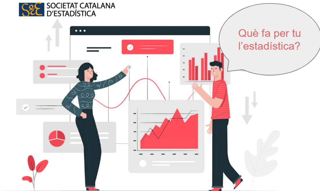
Caratula de l'activitat de "Per a què serveix l'estadística?"