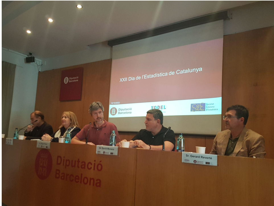
Instantània de la celebració del dia de l'estadística del 2022